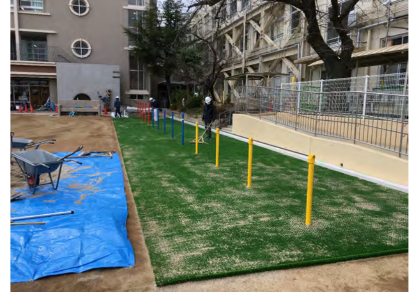
目砂入れ作業(擦りこみ)