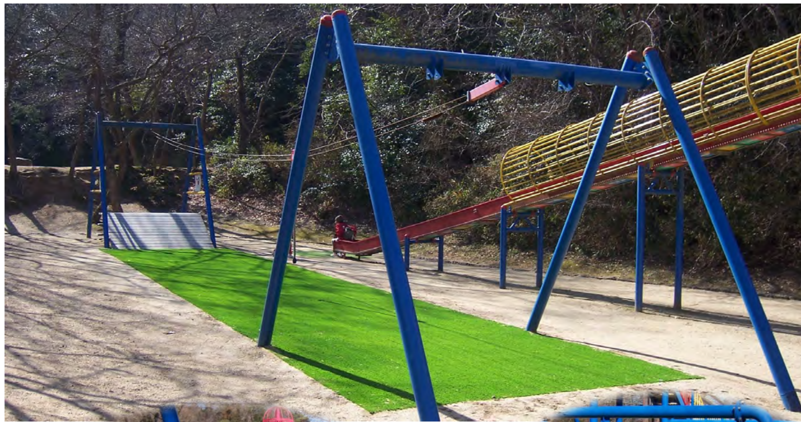
公園(遊具下) デビロン#260(基盤ゴム質)敷設