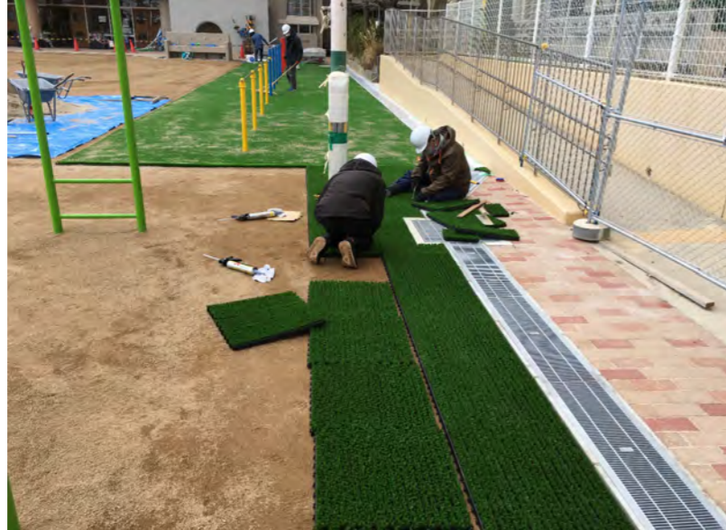
敷設作業(連結部の接着)