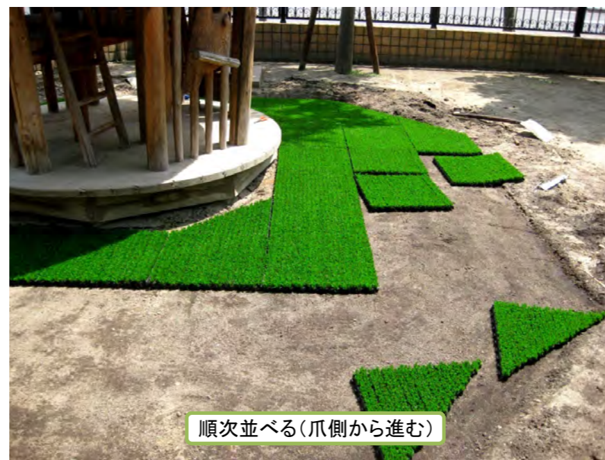
順次並べる(爪側から進む)