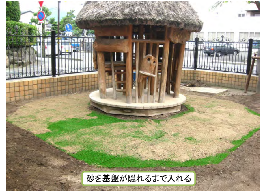
砂を基盤が隠れるまで入れる