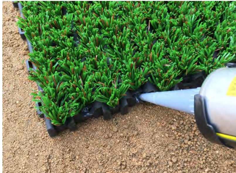
敷設作業(連結部の接着)