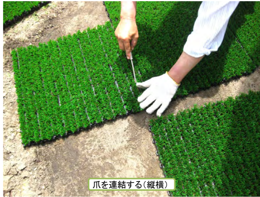
爪を連結する(縦横)